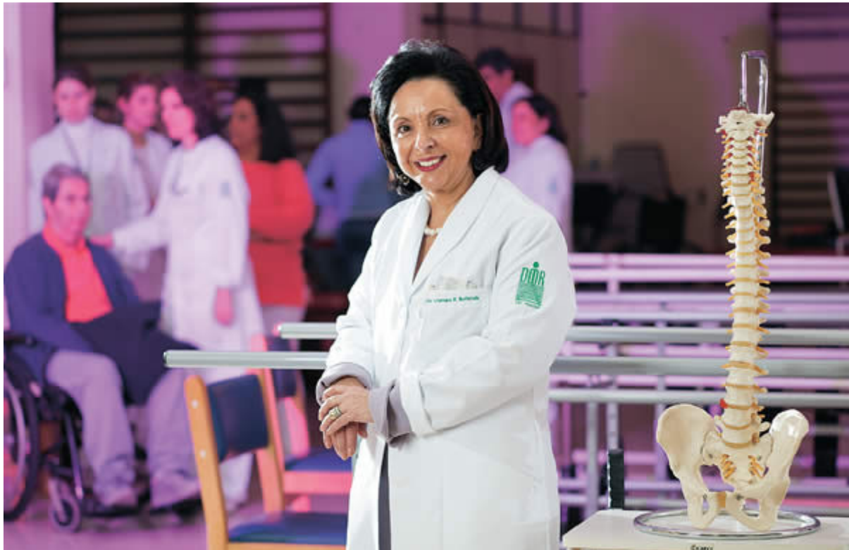
TERAPIA Para Linamara, a neuroprótese será a melhor alternativa de reabilitação

peculiar. A gente aprende a se localizar no cérebro quando está operando não só pelas coordenadas tridimensionais, mas pelo som. Passei 20 anos ouvindo isso", diz Nicolelis.